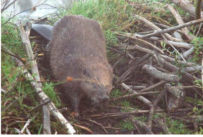
→ Le castor

La Flandre compte entre 50 et 100 castors sur son territoire en 2009. La présence de l'espèce est signalée sur la Dyle flamande, le Démer, l'Escaut, le Geer et sur la Meuse limbourgeoise.