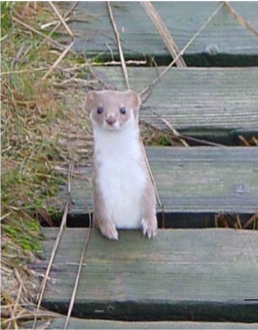
→ La belette