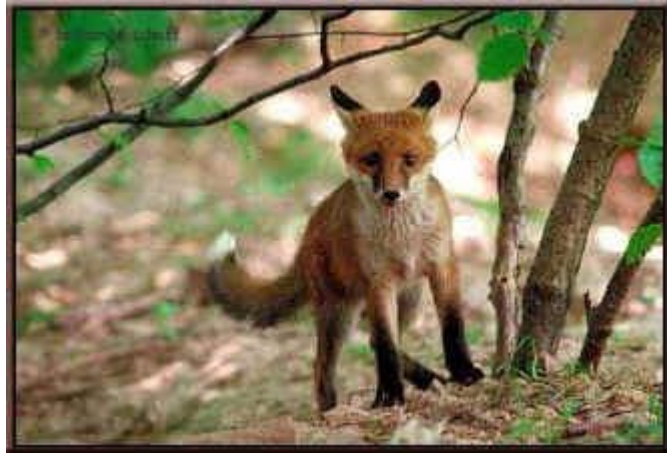
Le renard roux

Sa situation en Belgique : L'aire de répartition du renard roux recouvre toute la Belgique. Il est présent de la côte (Zwin et Westhoek) aux Ardennes et aux Hautes Fagnes. Il est présent en ville et dans leurs périphéries (Bruxelles, Liège,...).