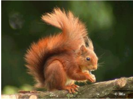
→ L'écureuil roux

On le trouve dans tous les sites boisés de Belgique et dans certains parcs urbains.