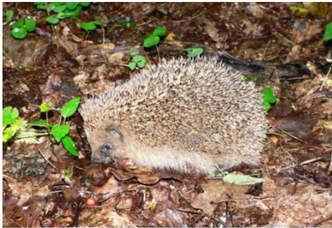
→ Le hérisson

On le trouve dans tous les sites boisés de Belgique et dans certains parcs urbains.