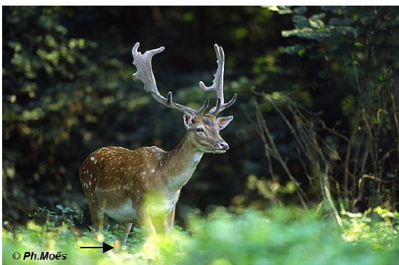
→ Le daim

En Belgique, il reste une centaine de daims à l'état sauvage, on les trouve principalement à Ciergnon, dans la région de Rochefort. Quelques daims sont observés de temps à autre dans d'autres forêts belges.