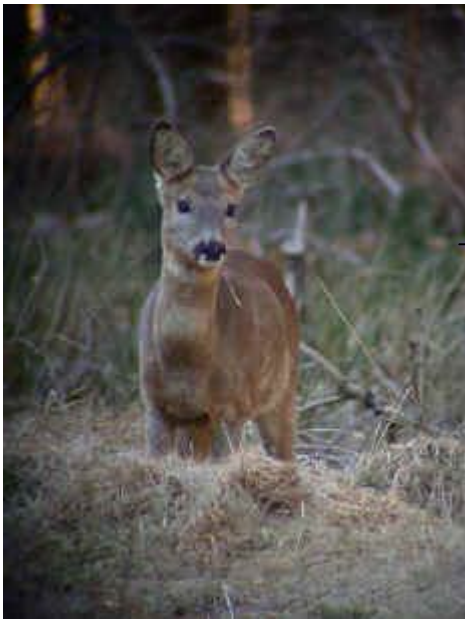
→ Le chevreuil

La Flandre compte entre 50 et 100 castors sur son territoire en 2009. La présence de l'espèce est signalée sur la Dyle flamande, le Démer, l'Escaut, le Geer et sur la Meuse limbourgeoise.