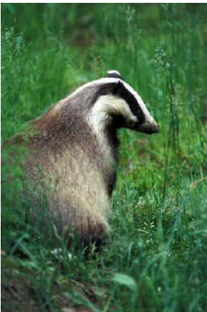
→ Le blaireau

Le blaireau d'Eurasie est le plus grand mustélide d'Europe de l'Ouest. Un blaireau adulte mesure entre 60 et 90 cm du museau à la base de la queue pour une hauteur au garrot de 30 cm. La taille de sa queue varie entre 15 et 27 cm. Le poids moyen du blaireau est de 12 kg. Cependant, au sortir de l'hiver celui-ci peut peser 7-8 kg tandis qu'à l'automne son poids peut dépasser les 20 kg.