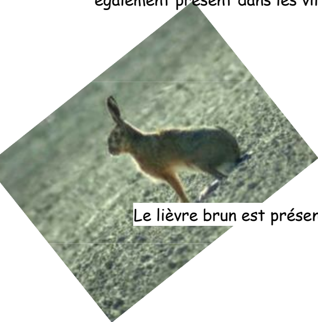
→ Le lièvre

En Belgique, on peut le rencontrer de la mer jusqu'aux Hautes Fagnes. Il est également présent dans les villes (Bruxelles, Anvers, Liège,...).