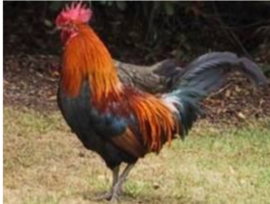
Slika 2: Petelin