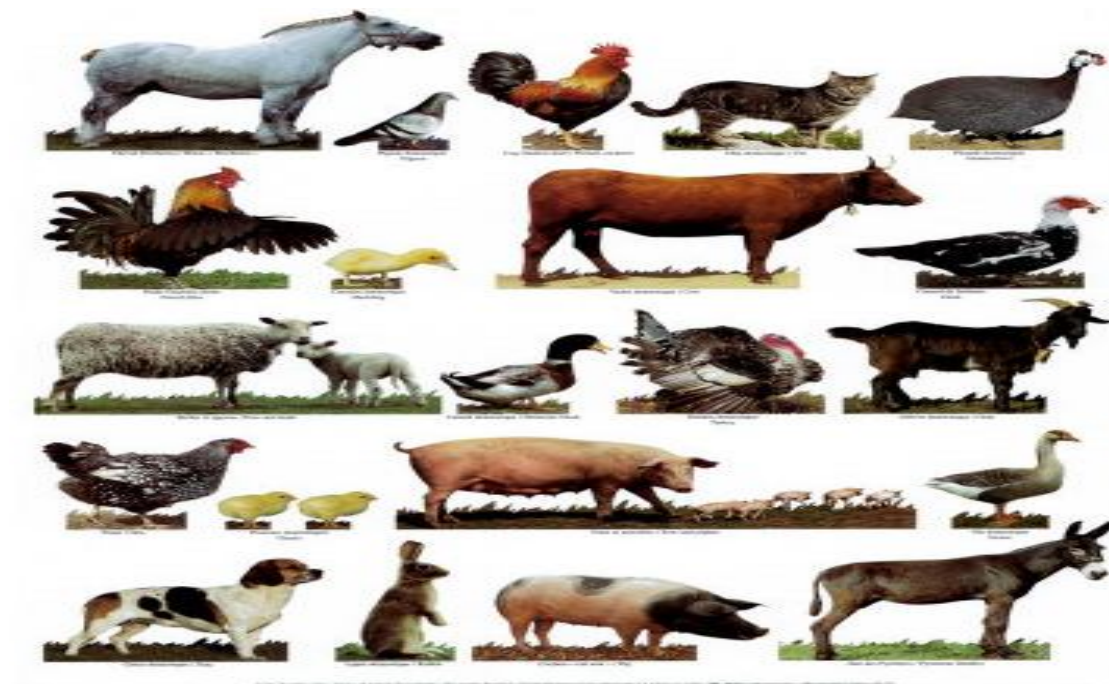
Slika 1: Domače živali

Za to projektno nalogo sem se odločil z Domače živali ker so zelo lepe. Doma imamo veliko domačih živalih. Za domače živali moram zelo skrbeti. Domače živali so zelo in pridne.