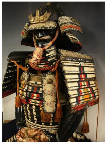
Slika 10: Samurajski oklep

Oklep je zaščitni sloj na telesu, ki je namenjen zaščititi uporabnika v bojnih situacijah. Oklep sodi med osnovno opremo vojakov že nekaj tisočletij, njegova zgradba odraža stopnjo tehnološke razvitosti ljudstev, ki so ga uporabljala. V začetku so oklepe izdelavali iz usnja, živalskih kož in kosti, z razvojem obdelovanja kovin pa so pričeli izdelovati oklepe iz tankih kovinskih plošč ali prepletenih obročkov.