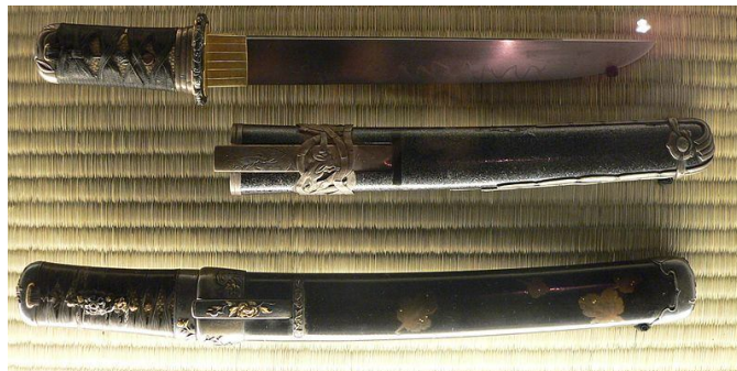
Slika 10: Dva tanta

Nože tanto so večinoma nosili samuraji, navadni ljudje jih navadno niso posedovali. Ženske so včasih za samoobrambo nosile majhen tanto, imenovan kaiken. Pred 16. stoletjem je samuraj nosil tanto in tachi, to se je pozneje zamenjalo z wakizašijem in katano. Tanto je bil tudi priljubljeno orožje nindž, ki so ga občudovali zaradi njegove lahkote in koristnosti.