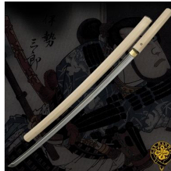
Slika 5: Shirasaya