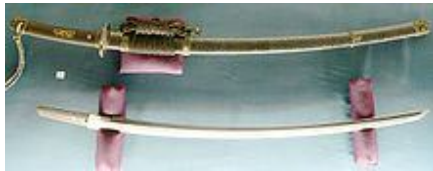
Slika 3: Tachi