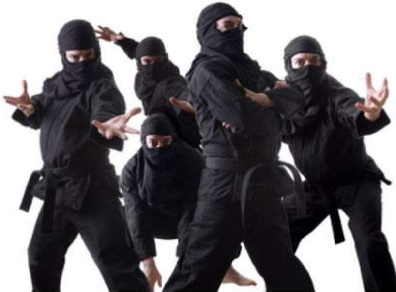
Slika 10: Skupina nindž