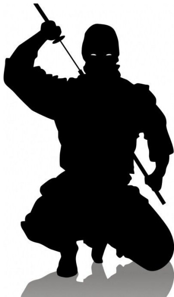
Slika 9: Nindža

Nindža je bil v japonski zgodovini plačanec, morilec, speciallec veščine ninjutsu. Nindže so bili prvo plačanci potem so se skozi njih začele razvijati organizacije ali klani nindž. Na vrhu klana je bil ninja mojster. Ena izmed najmočnejših klanov nindž sta bila Iga in Koga. Nindža se prvič pojavi v 14. stoletju kot plačanec. Nindže so bile velike sovražnice samurajev, vendar so bili samuraji na boljšem pri orožju in opremi.