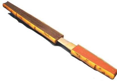
Slika 11: Tanto, skrit v pahljačo