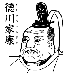
Slika 1: Ieyasu Tokugava