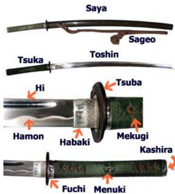
Slika 9: Podrobni deli katane