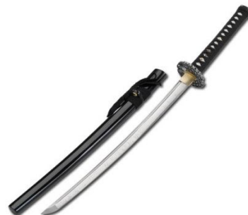
Slika 6: Wakizashi