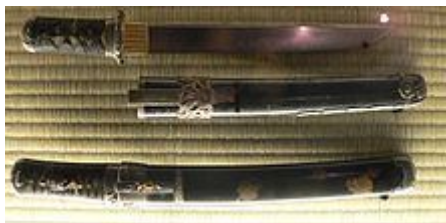
Slika 4: Tanto