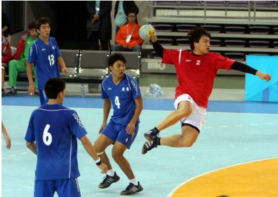
Slika 1: Strel iz skoka

To temo sem izbral, ker treniram rokomet že tri leta. Zelo rad ga igram, čeprav je ta šport bolj grob. V tej projektni nalogi vam bom predstavil nekaj informacij o tej športni panogi. Predstavil vam bom zgodovino in začetke rokometu, pravila, opremo, razna tekmovanja, najuspešnejše klube in igralce