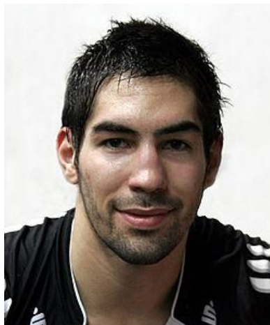
Slika 4: Nikola Karabatić

Trenutno igra za rokometno reprezentanco Francije in francoski klub Montpellier HB .