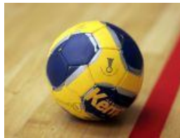
Slika 2: Rokometna žoga