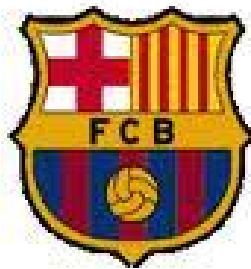
Slika 10: grb FC Barcelona Handbol